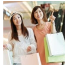
デパート・スーパー