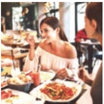
レストラン・飲食店